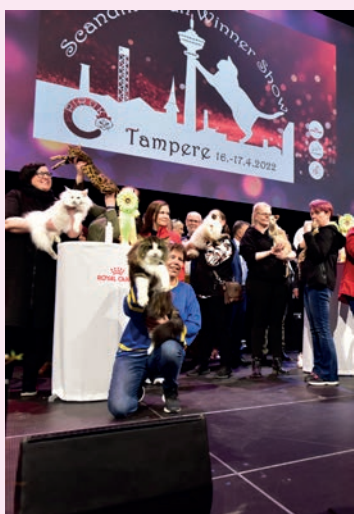
Scandinavian Winner -näyttelyn juhlahumua